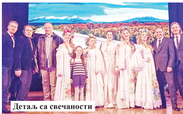
Детаљ са свечаности

ло високообразовно. Ради прихватања ових избеглица била је потребна државна стратегија. Формиране су разне институције и друштва, које су бринуле о пријему, смештају и основним животним потребама избеглих Руса. Међу њима се нарочито истицао Руски културни одбор, на чијем челу је био академик Александар Белић. Ови Руси су почели да се баве научном и културном делатношћу и у срединама у којима су живели, и изузетно су допринели науци и култури. Из потребе за формирањем једне институције која ће неговати руску националну културу и научну делатност, потекла је идеја о изградњи Руског дома. Грађевина је изграђена у стилу руског ампира, која подсећа на дворце Петербурга. Пројектант је био Василије Фјодорович фон Баумгартен (пројектовао и зграду Старог генералштаба). Трошкове изградње Руског дома је финансирао краљ Александар I од својих личних средстава, а званично отварање Руског дома „Цар Николај II” уприличено је 9. априла 1933. године – речено је, осим осталог, на обележавању јубилеја.