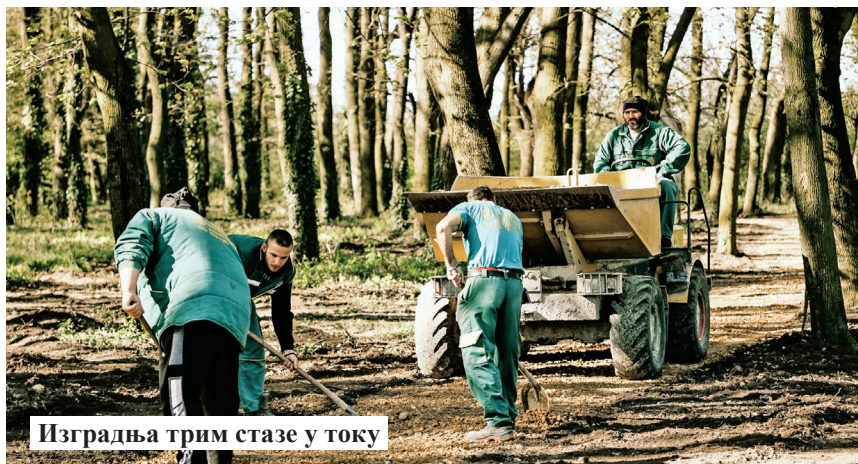
Изградња трим стазе у току