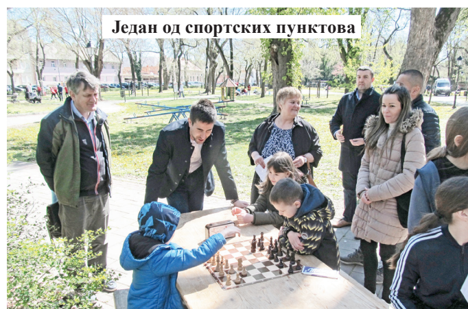
Један од спортских пунктова