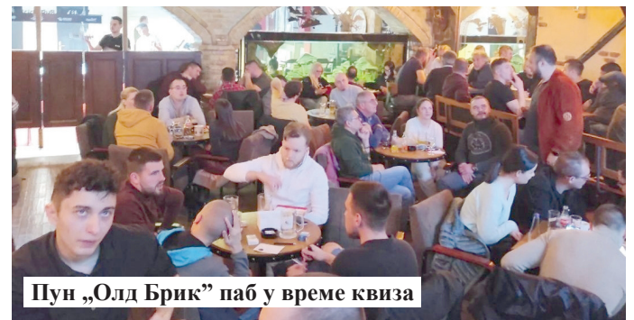
Пун „Олд Брик“ паб у време квиза

Екипе састављене од три до пет играча бирају једну област коју мисле да најбоље познају у којој ће дуплирати освојене поене и једну област коју желе да прескоче. Поени се на крају сабирају и најбоље три екипе, као и последњепласирана екипа добијају награде.